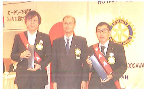
結婚記念日お祝い