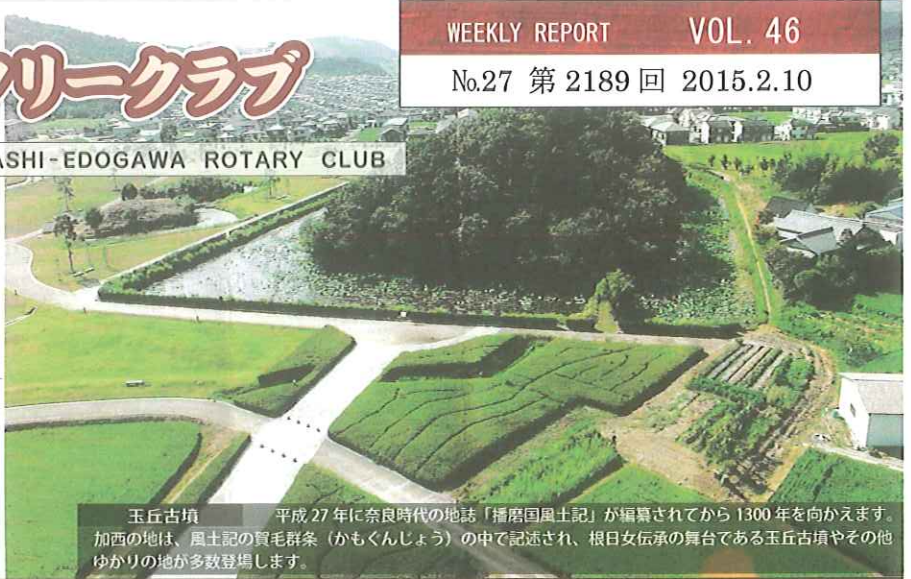
玉丘古墳 平成 27 年に奈良時代の地誌「播磨国風土記」が編纂されてから 1300 年を向かえます。加西の地は、風土記の賀毛群条（かもくんじょう）の中で記述され、根日女伝承の舞台である玉丘古墳やその他ゆかりの地が多数登場します。

◆例会日◆ 毎週火曜日 12:30~13:30 ◆創立◆ 1969年9月18日(日本で951番目)