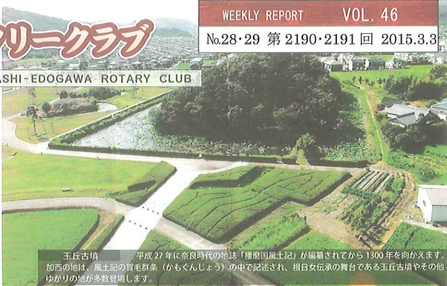
玉丘古墳 平成27年に奈良時代の地誌「播磨国風土記」が編纂されてから1300年を向かえます。加西の地は、風土記の寶毛群条(かもくんじょう)の中で記述され、根子女伝承の舞台である玉丘古墳やその他ゆかりの地が多数登場します。

◆例会日◆ 毎週火曜日 12:30~13:30 ◆創立◆ 1969年9月18日(日本で951番目)