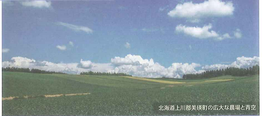
北海道上川郡美瑛町の広大な農場と青空

◆ 例会日 ◆ 毎週火曜日 12:30~13:30 ◆ 創 立 ◆ 1969年9月18日(日本で951番目)