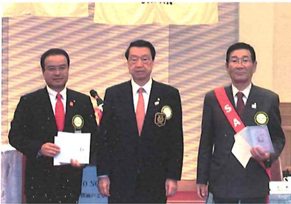
○10月9日に開催されました、江戸川区民まつり協力のお礼状を頂戴致しました。