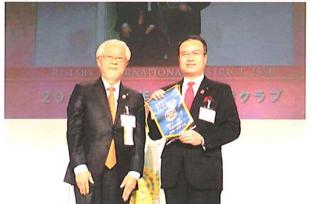
出席優秀クラブ(2015-16年度)第一位