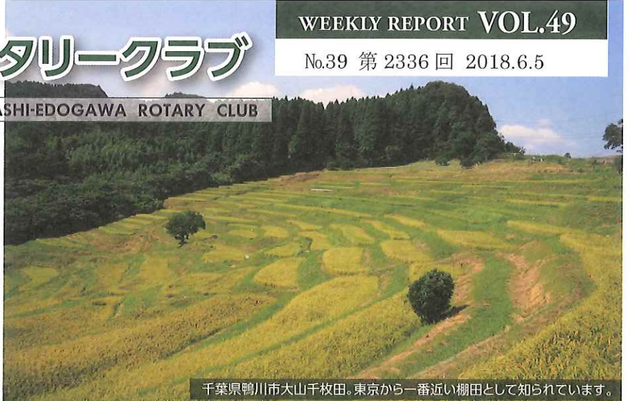
千葉県鴨川市大山千枚田。東京から一番近い棚田として知られています。