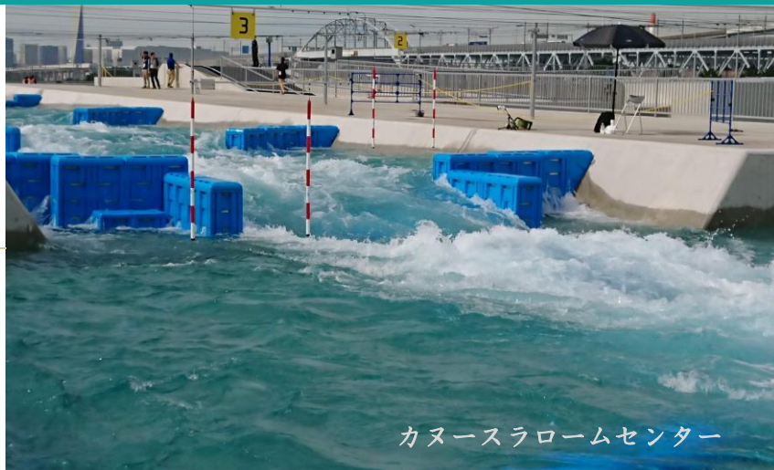
カヌースラロームセンター