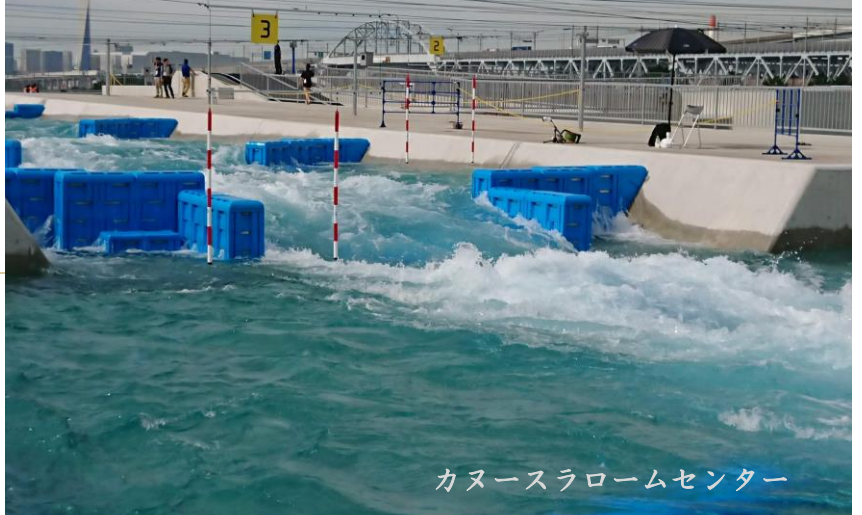
カヌースラロームセンター