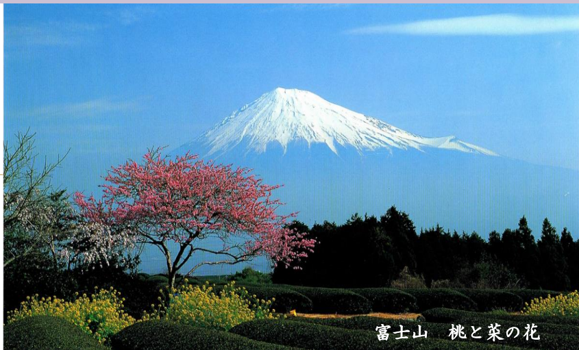
富士山 桃と菜の花