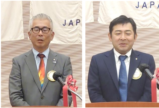
○城戸会員より、長沼 RC とのバナー交換報告。