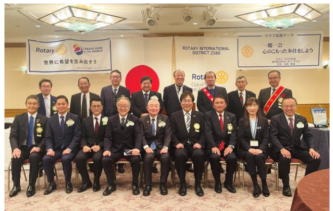
卓話謝礼をニコニコに頂戴いたしました。