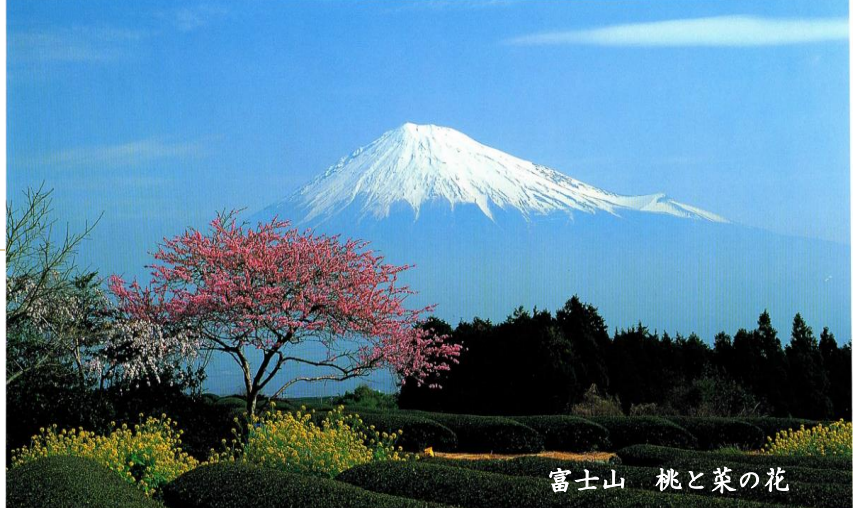
富士山 桃と菜の花