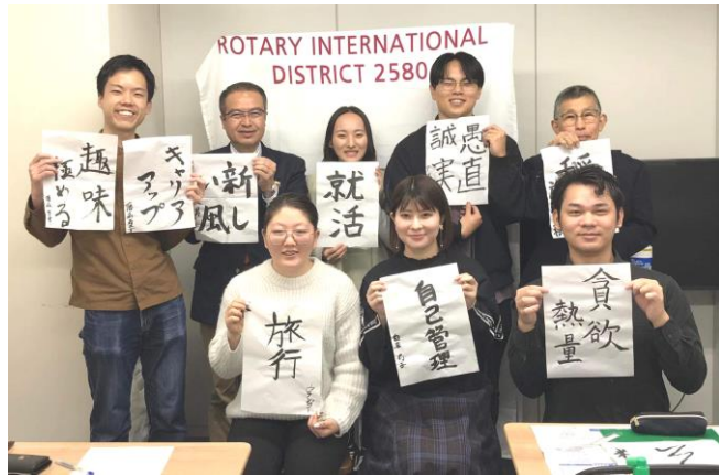
(記：唐 澤 正 樹)