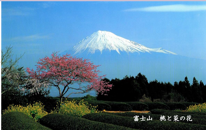
富士山 桃と菜の花