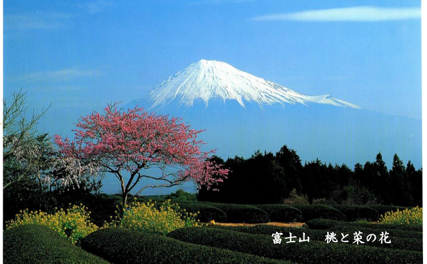
富士山 桃と菜の花