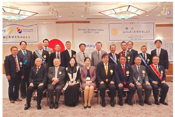
卓話謝礼をニコニコに頂戴いたしました