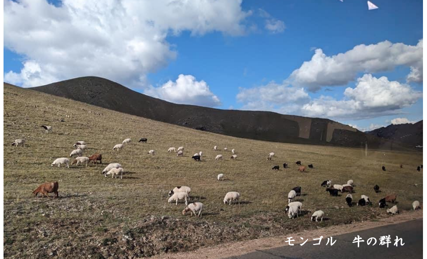
モンゴル 牛の群れ