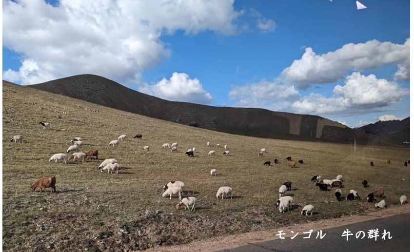
モンゴル 牛の群れ