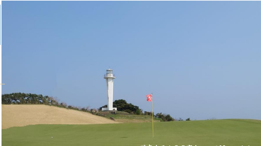
川奈ホテルGC富士コースNo. 11