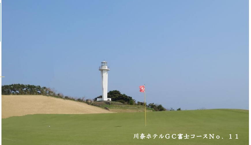
川奈ホテルGC富士コースNo. 11